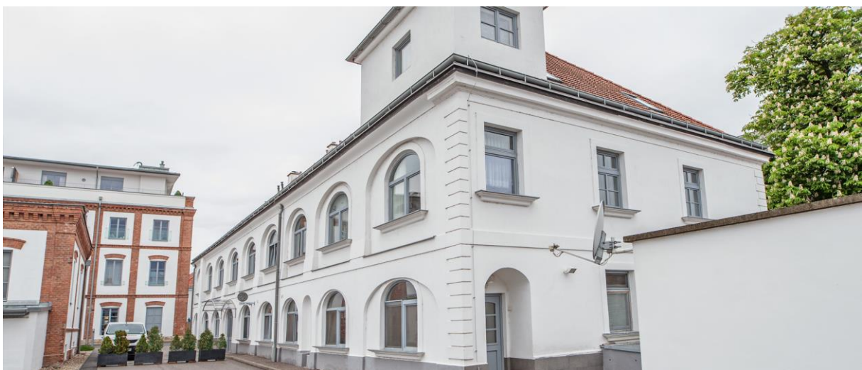
Der schöne Denkmalgeschützte Altbau gehört zum Areal Alte Spinnerei Fabrik.